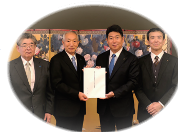
税制改正要望活動