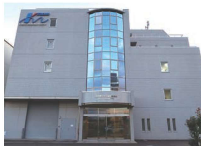
川崎市高津区にある本社

今後の展開については、環境測定に使うガス検知器の安全性を高めるなど、現在の事業を発展させていながら、人の命を守るためにいろいろなお品を開発していきたいと語った。