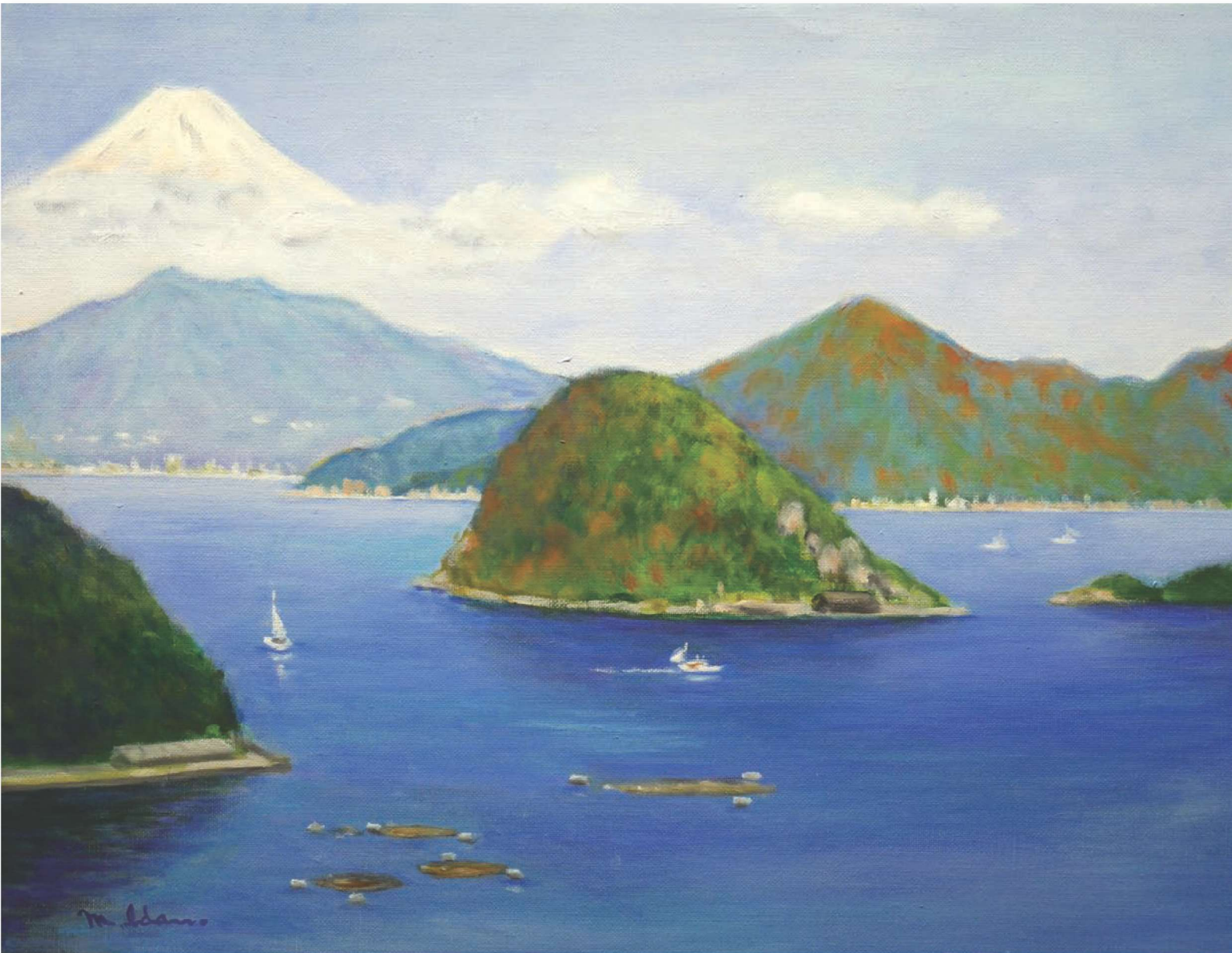
の富士遠望」(沼津市) P10号 油彩 井田光政 画