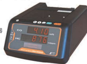
自動車の排ガス測定器

ほかにも特殊な事例として、美術館の仕事を挙げてくれた。そこでは100万分の1以下のガスを検知するといった高レベルの検知器を開発し、美術品の酸化や劣化を防ぐことに寄与している。